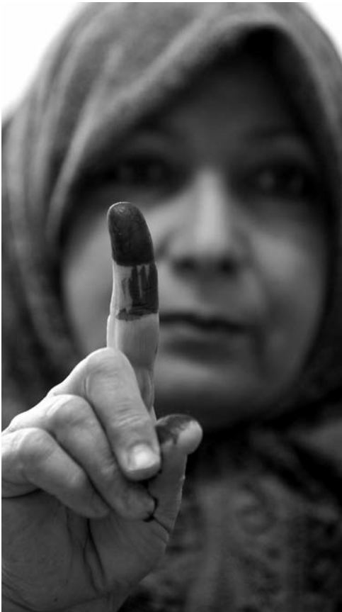
En irakisk velger i valget 7. mars i år.

sekteriske linjer. 39 Det er godt mulig at det først og fremst ligger strategiske hensyn bak dette samarbeidet, men over tid kan dette bidra til å normalisere forholdet mellom sunni- og sjiamuslimer.