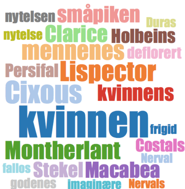
Figur 5. Ordsky som karakteriserer tekstutvalget

Som det fremgår av ordskyen i Figur 5, skiller tekstutvalget seg hovedsakelig ut når det gjelder ord knyttet til seksualitet. Disse synes å være knyttet til en psykoanalytisk inngang til temaet; noe som signaliseres av ordene 'nyttelsen', 'nyttelse', 'deflorert', 'frigid', 'fallos'. I tillegg finner vi en gruppe egennavn som er knyttet til kunstverk eller litterære tekster som analyseres i utgivelsene (for eksempel 'Holbein' og 'Nerval'). Tekstene preges også av et til dels arkaisk