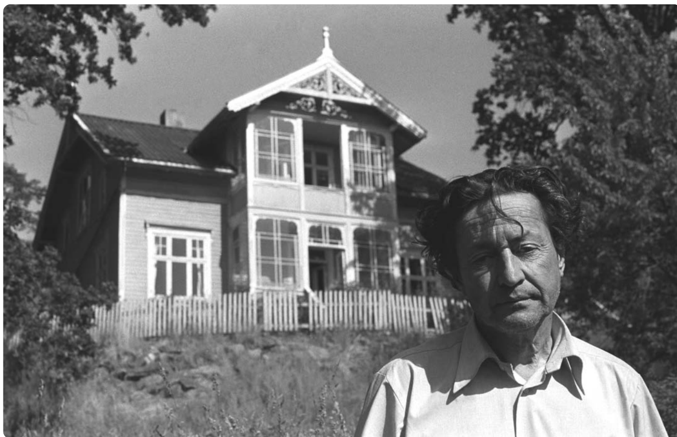
Jens Bjørneboe foran Eikvold, juli 1975.

forståelsesmåtene han er blitt gitt, det er dette som har passet med det kunstsyn han har hatt med seg helt fra ungdommen av. Det som ble bekreftet av eksempler som Isaac Grünewald, av hans forbilde Knut Hamsun og kanskje aller mest gjennom Rudolf Steiners lære. I tillegg har han hatt et intenst behov for å skape mening av sin situasjon.