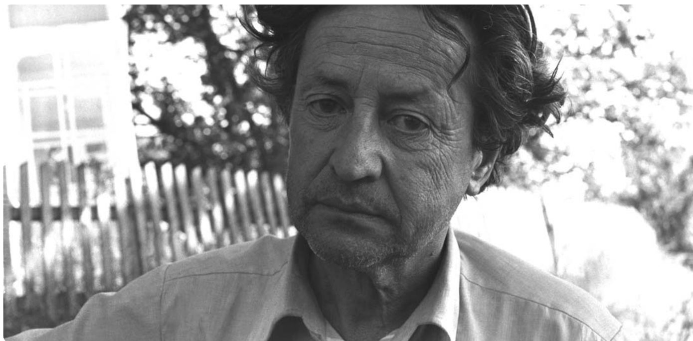
Bjørneboe, juli 1975.

rekke ganger i sin litteratur. I selvbiografien hadde han oppsummert et av sine tidligere selvmordsforsøk som “grenseløst dumt”. Det var å svike alt, å “avslutte det hele med en løgn”. Men nå var det det han hadde kommet. Var det så enkelt som at han ikke kunne tåle sannheten? Sannheten om sitt eget liv, om seg selv?